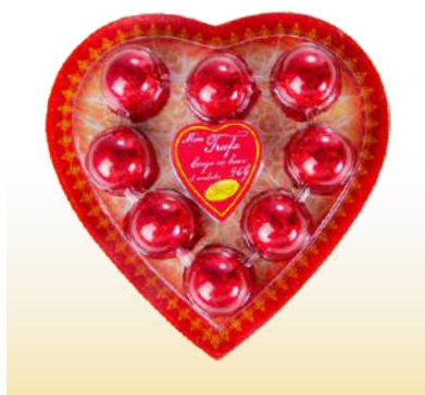
BLISTER CORAÇÃO CEREJA Cód. 127

Qtde de embalagem por caixa: 12 Qtde de unid. por embalagem: 18