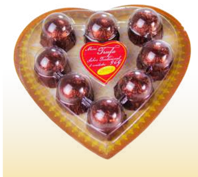
BLISTER CORAÇÃO TRADICIONAL Cód. 128

Qtde de embalagem por caixa: 20 Qtde de unid. por embalagem: 8