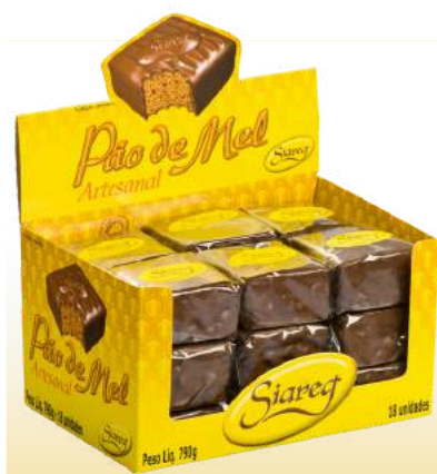
PÃO DE MEL DISPLAY Cód. 100

Qtde de embalagem por caixa: 12 Qtde de unid. por embalagem: 18