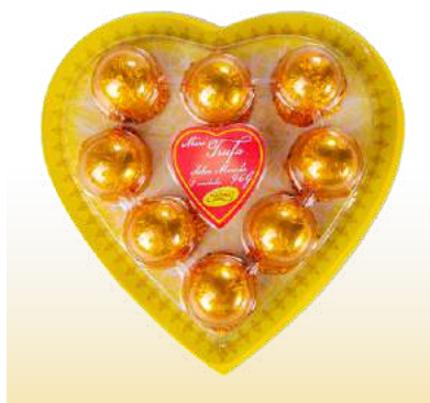
BLISTER CORAÇÃO MARULA Cód. 117

Qtde de embalagem por caixa: 20 Qtde de unid. por embalagem: 8