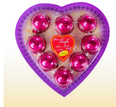
BLISTER CORAÇÃO AVELÃ Cód. 121

Qtde de embalagem por caixa: 20 Qtde de unid. por embalagem: 8