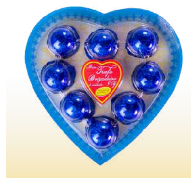
BLISTER CORAÇÃO BRIGADEIRO Cód. 116

Qtde de embalagem por caixa: 20 Qtde de unid. por embalagem: 8