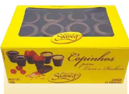
COPINHO PARA LICOR | RECHEIO Cód. 131

Qtde de embalagem por caixa: 14 Qtde de unid. por embalagem: 25