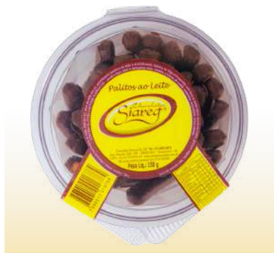
PALITOS COBERTO POTE Cód. 118

Qtde de embalagem por caixa: 24 Qtde de unid. por embalagem: 150gr.