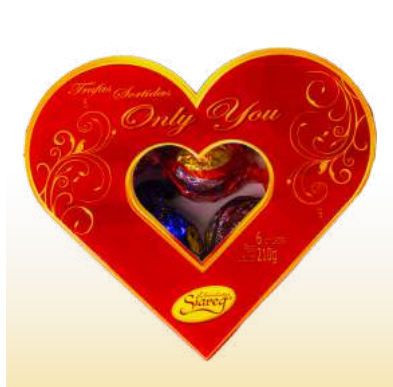
CORAÇÃO ONLY YOU Cód. 149

Qtde de embalagem por caixa: 12 Qtde de unid. por embalagem: 18