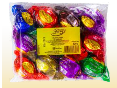
TRUFA SORTIDA PACOTE Cód. 104

Qtde de embalagem por caixa: 24 Qtde de unid. por embalagem: 150gr.