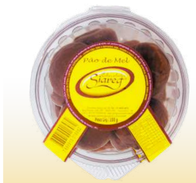
MINI PÃO DE MEL POTE Cód. 124

Qtde de embalagem por caixa: 24 Qtde de unid. por embalagem: 150gr.