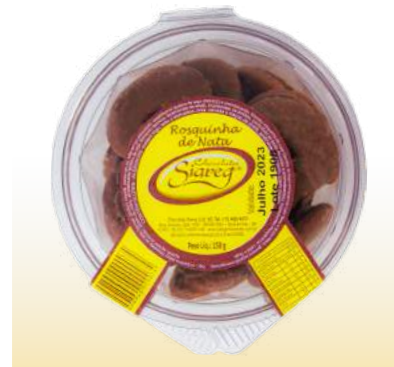
ROSQUINHA DE NATA Cód. 125

Qtde de embalagem por caixa: 24 Qtde de unid. por embalagem: 150gr.