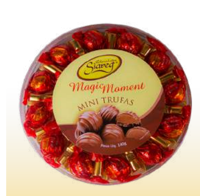
ESTOJO MORANGO Cód. 138

Qtde de embalagem por caixa: 10 Qtde de unid. por embalagem: 6