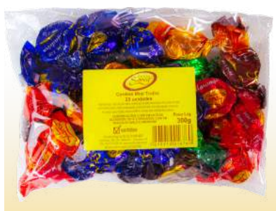
MINI TRUFA SORTIDA PACOTE Cód. 126

Qtde de embalagem por caixa: 12 Qtde de unid. por embalagem: 12