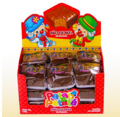
PÃO DE MEL PATATI PATATÁ Cód. 105

Qtde de embalagem por caixa: 16 Qtde de unid. por embalagem: 24